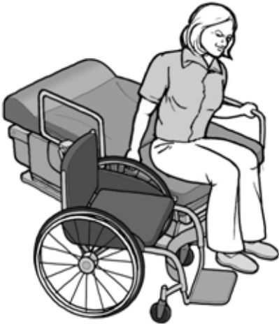
Se transfiere en el lado corto (de profundidad) de la superficie de transferencia