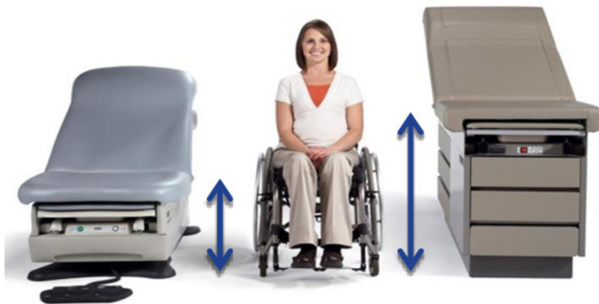
Altura accesible para transferencia fluctúa de 17 a 19 pulgadas