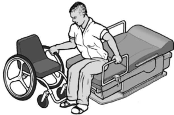
Se transfiere en el lado alargado (ancho) de la superficie de transferencia